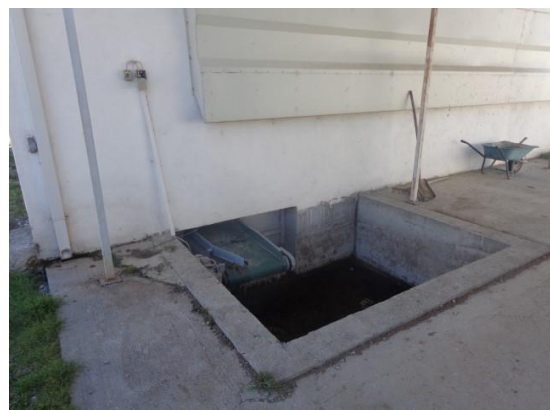
Slike 24 do 30 Oprema uz Objekt 4, kavezna oprema za uzgoj 18 tjednih pilenki (5.5.)