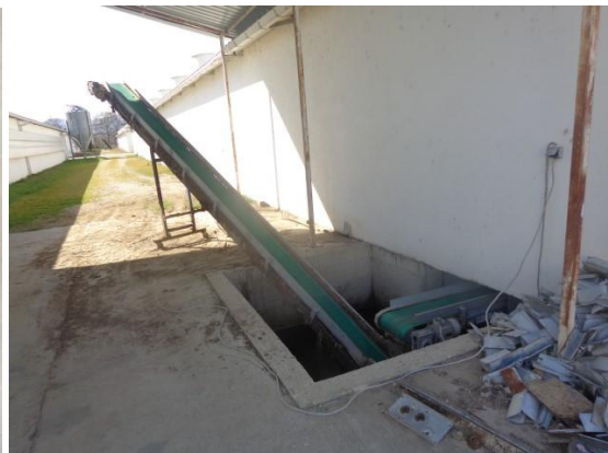
Slike 17 do 23 Oprema uz Objekt 3, kavezna oprema za nesilice za proizvodnju jaja (5.3.)