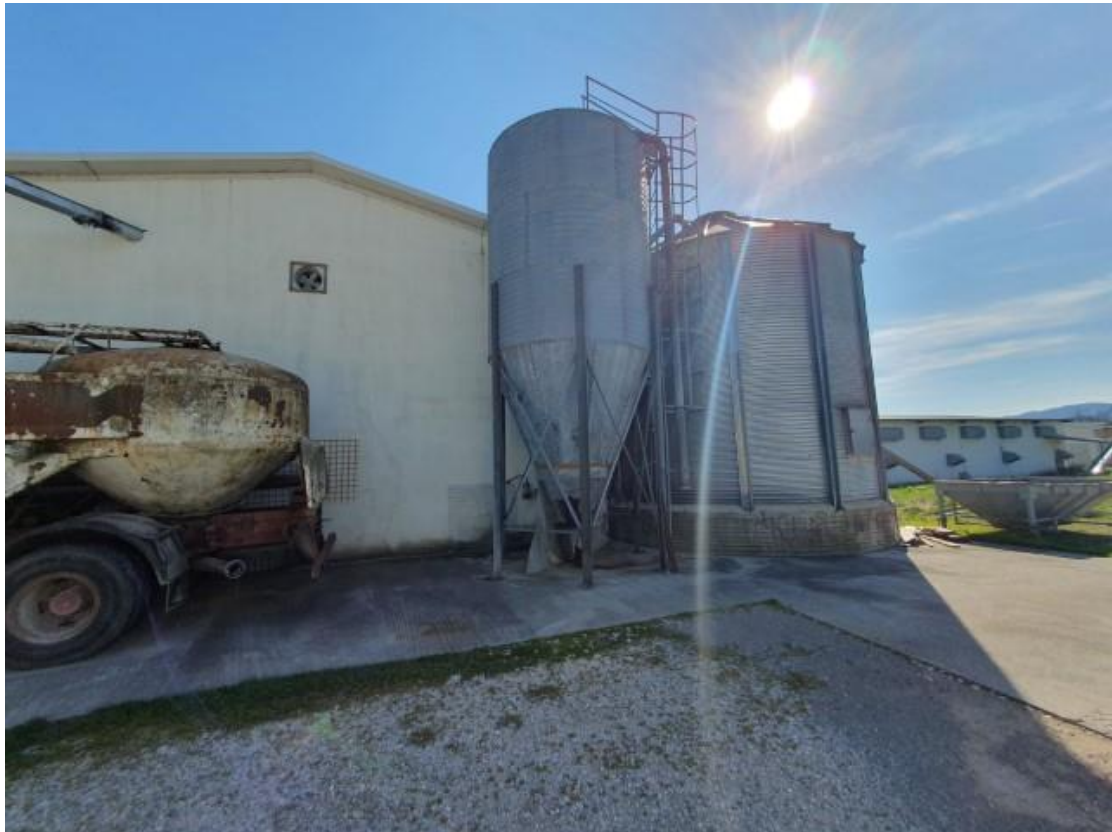
Slika 40 Silosi za spremanje kukuruza i sojine sačme (5.7.)