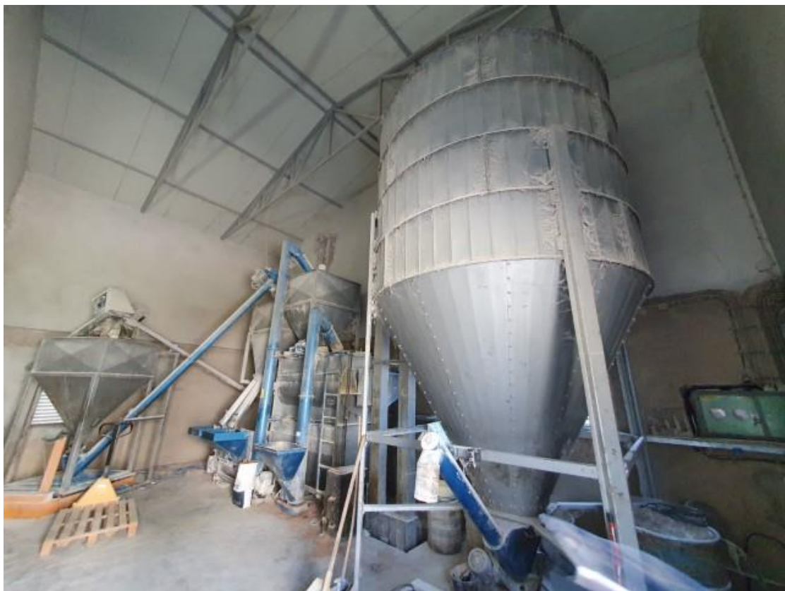
Sl. 41 Linija za proizvodnju stočne hrane (5.8.)