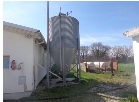
Slike 10 do 16 Oprema uz Objekt 2, kavezna oprema za uzgoj 18 tjednih pilenki (5.2.)