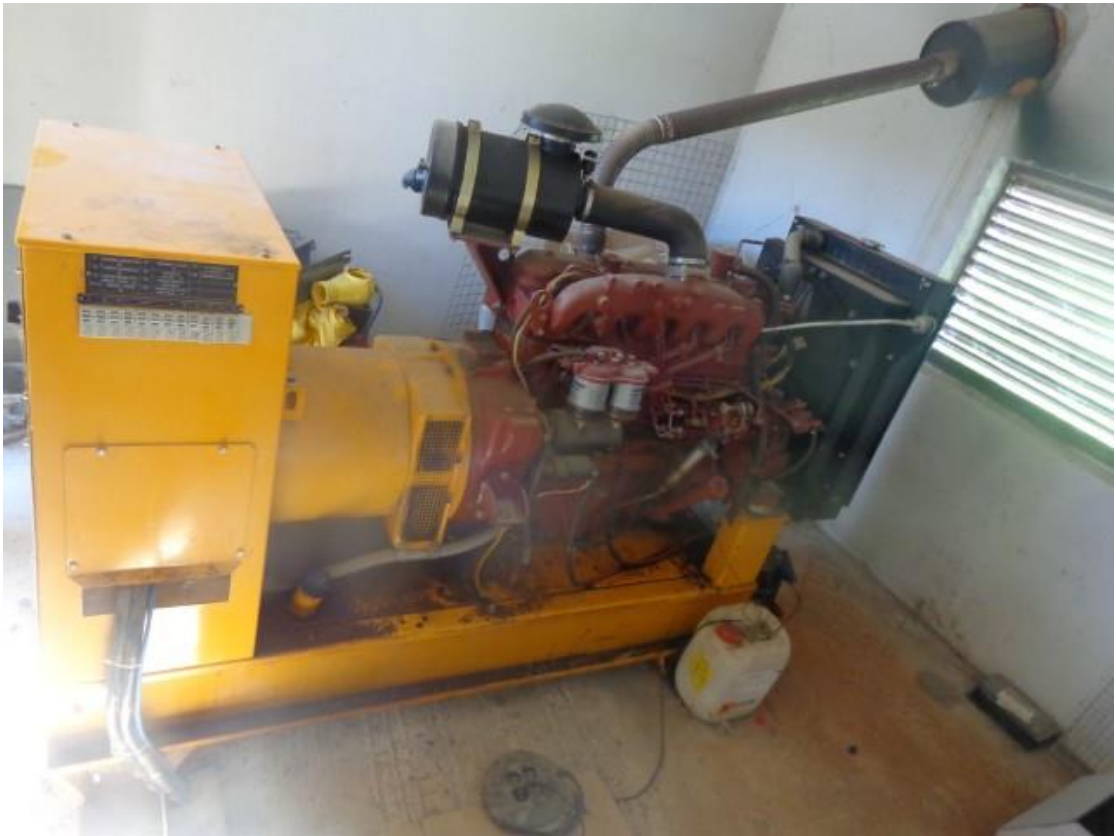
Slika 38 Diesel agregat Končar za napajanje el. energijom (5.4.)