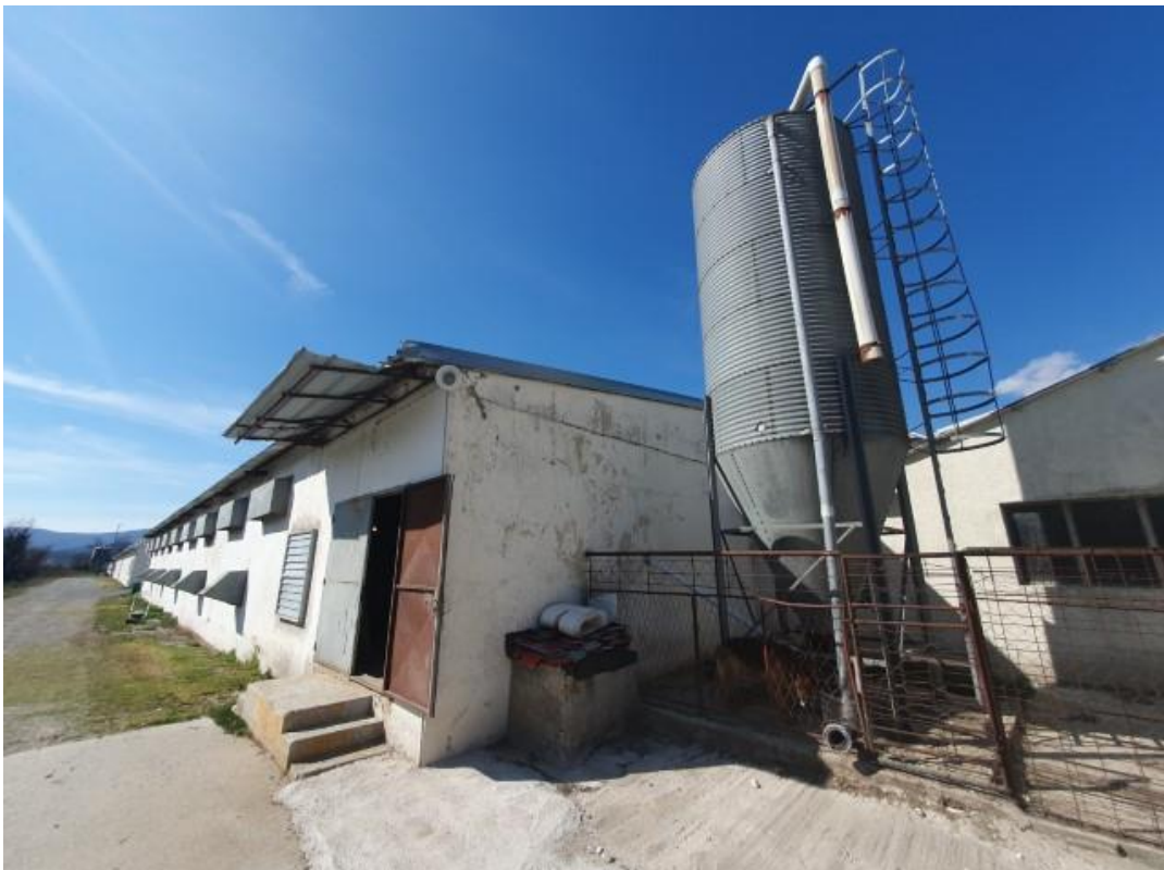
Slika 2. Objekt „Stara Mostina“ u koji su smještene nesilice za proizvodnju konzumnih jaja (5.6.)