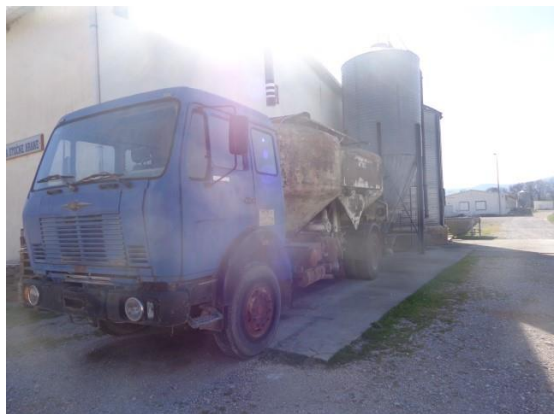
Slike od 42 do 49 Vozila