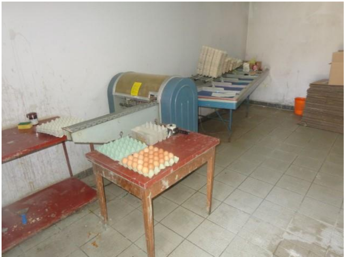
Slika 39. Linija za sortiranje jaja (5.7.)