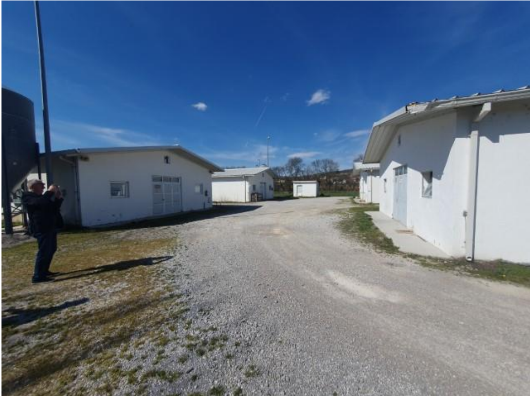
Slike 1. Objekti 1, 2, 3 i 4 u koje su smještene kavezne opreme za uzgoj 18-tjednih pilenki (5.1., 5.2. i 5.) te nesilice za proizvodnju konzumnih jaja (5.3.)