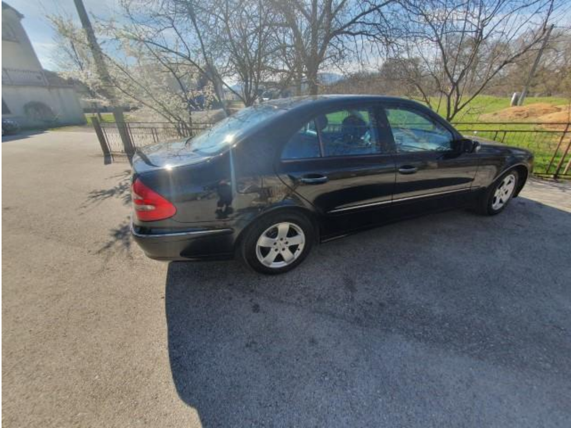
Slika 50 Osobno vozilo Mercedes