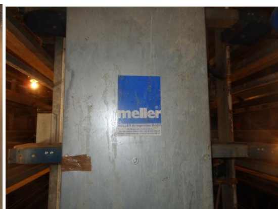
Slike 31 do 37 Objekt „Stara Mostina“, kavezna oprema za nesilice za proizvodnju jaja (5.6.)