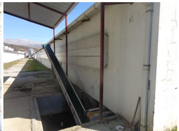
Slike 3 do 9. Oprema uz Objekt 1, kavezna oprema za uzgoj 18 tjednih pilenki (5.1.)